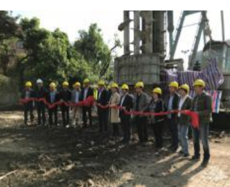
集团杭州第二中学东河校区项目举行开工典礼

4月19日上午,在具有120年历史的杭州第二中学东河校区内,由集团承建的杭州第二中学东河校区求是楼、三好楼新建项目举行了隆重的开工典礼。