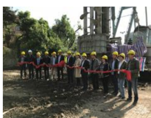
集团杭州第二中学东河校区项目举行开工典礼

4月19日上午,在具有120年历史的杭州第二中学东河校区内,由集团承建的杭州第二中学东河校区求是楼、三好楼拆建项目举行了隆重的开工典礼。